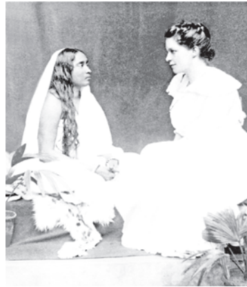
श्रीमाँ सारदा के संग सिस्टर निवेदिता

बाँकुरा की पुलिस ने दोनों स्त्रियों को गिरफ्तार कर लिया और उनके गाँव जूथबेहार से पुलिस स्टेशन तक जबरन पैदल चलाकर ले गए। पुलिस से कहा गया कि वे गलत कर रहे हैं। स्त्रियों को पुलिस स्टेशन तक जाने के लिए उपयुक्त साधन का सुझाव दिया गया, लेकिन पुलिस ने कोई ध्यान नहीं दिया। जमानत की अर्जी निरस्त कर दी गई और स्त्रियों को कई प्रकार से अपमानित किया गया। काली, माँ