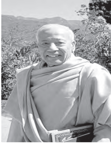
स्वामी प्रभवानन्द जी महाराज

मुझे स्मरण है कि हॉलीवूड पहुँचने के एक माह के अन्दर ही मुझे रविवार का प्रवचन करने को कहा गया। प्रवचन के पश्चात् महाराज के कमरे में जाने पर उन्होंने मुझसे पूछा कि तुमको stage fright (मंचभय) हुआ कि नहीं? मैंने कहा, “महाराज, मेरा पैर तो नहीं काँपा, परन्तु पेट काँपा था।” उन्होंने हँसकर कहा कि मेरे जैसा ही हुआ। उन्होंने मुझको उत्साहित करते हुए कहा, “देखो, थोड़ा-सा