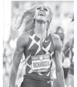
शा कैरी रिचर्डसन

लगभग दो वर्ष पहले कैरी की माँ की मृत्यु हुई। वे माँ की मृत्यु के आघात को सहन न कर पायीं और इस आघात से उबरने के लिए उन्होंने गाँजा का सेवन करना प्रारम्भ कर दिया था। इसलिए उन्हें खेल से एक महीने के लिए निलम्बित कर दिया गया। उच्च विद्यालय में भी उन्हें ऐसी ही स्थिति का सामना करना पड़ा था। उन्होंने आत्महत्या करने का प्रयास किया था, क्योंकि उनके साथ कोई दौड़ने के लिए तैयार नहीं था। वर्ष २०२१ में वे डोप टेस्ट में असफल हुईं और टोक्यो ओलंपिक से बाहर हुईं, इस प्रकार वे कई आलोचनाओं की शिकार हुईं। कैरी बहुत उदास हो चुकी थीं, परन्तु उनके परिवार (मौसी और नानी) के सदस्यों ने कठिन समय में कैरी का पूरा साथ दिया। कैरी ने विपरीत परिस्थितियों का दृढ़ता से सामना किया और सभी आलोचनाओं की परवाह न करते अपने आपको लक्ष्य की ओर केन्द्रित किया। कैरी सब कठिन परिस्थितियों